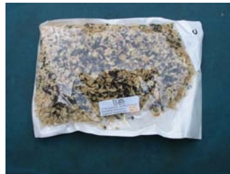
Emballage de pupes parasitées mélangées à des copeaux de bois.

Fournisseurs canadiens qui expédient partout au pays :